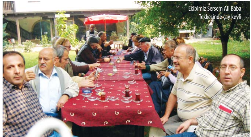
Ekibimiz Sersem Ali Baba Tekkesinde çay keyfi

ve bir süre sohbet ettikten sonra bizlere ikram edilen ayran ve börekleri afiyet ile yiyoruz. Daha sonra da Tekkeden ayrılarak Alaca Camisine gidiyoruz.