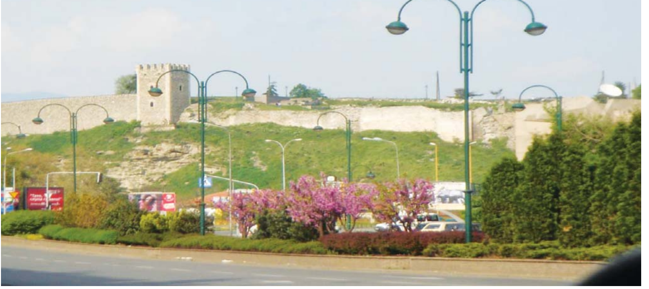
Yıldırım Beyazıt tarafından yaptırılan Üsküp Kalesi

geçmiş ve orada samimi olduğu bir ajan tarafından öldürülmüştür. Üsküp'te şehit düşen dedelerimiz için Fatihalar okuyarak oradan ayrılıyor ve doğruca kaleye gidiyoruz.