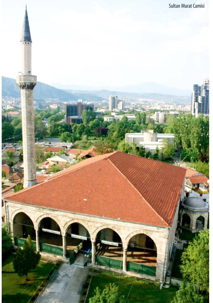
Sultan Murat Camisi

Öncelikle Üsküp kalesi, eski Postane ve Hükümet binasını görüyoruz. Oradan Ülkemizin restore ettiği Mustafa Paşa Camisi ve Türbesini ziyaret ediyor ve caminin hemen arkasından eski Üsküp'ü seyre dalıyoruz.