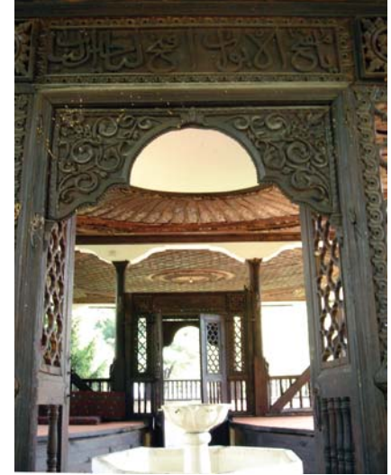
Tekkenin yazlık sohbet bölümleri

Bu tekke 24 bin m 2 alanı ile Osmanlı coğrafyasındaki en geniş araziye sahip tekkedir. Tekkenin içinde Bektaşî Tarikatı üyeleri için sohbet hane ve hemen onun karşısında diğer Müslümanlar için Cami var. Ekibimiz içindeki namaz kılan arkadaşlar ile birlikte Tekke içindeki camide namazımızı kıldıktan sonra Tekkenin Şeyh'ini ziyaret ettik. Şeyh Efendi bizi çok sıcak ve samimi karşıladı. Bir süre sohbetten sonra Şeyh Efendi mahalli şive ile bize " Şimdi siz kılayınız beden namazı, ama bilmiyisinizki bizlerde kılayı gönül namazı " diye söyleyerek latife yapıyor. Şeyh ile görüşmenin akabinde Tekkenin açık hava sohbetlerinin yapıldığı kısma geçiyor