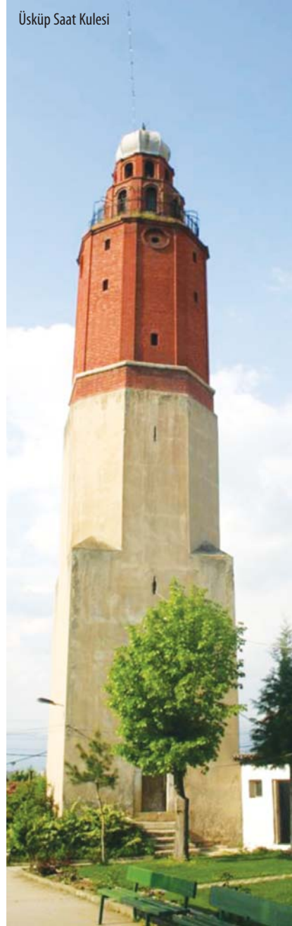
Üsküp Saat Kulesi

Bir süre geziye ara veriyor ve Üsküp'ün harika köftelerinden tattımaya gidiyoruz. Köftenin en güzel yapıldığı bölgelerden biri de Balcanlardır.