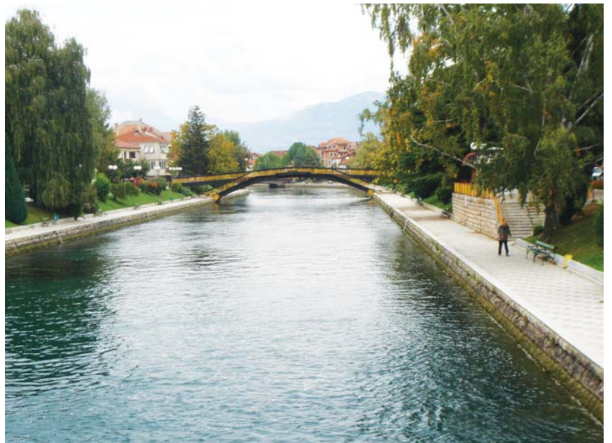
Struga Şehri: Karadirim Nehri Dünya Şiir Akşamlarının yapıldığı köprü

Ohri'yi geride bırakırken sağlı sollu elma bahçeleri arasından geçerek Struga şehrine geliyoruz. Struga şehri Ohri gölünün kenarında kurulmuş güzel bir şehir. Şehirde üzerinde Türk Bayrakları yapıştırılmış arabalara rastlıyoruz. Aslında tüm nehirler göllere akar. Ohri gölünde ise ters bir durum var. Gölden bir nehir doğuyor. Struga'da Ohri gölünden doğan nehrin çıktığı