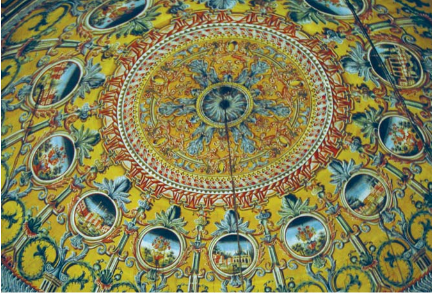
Alaca Camii kubbesinin iç görünümü

Osmanlı'nın Balkan Coğrafyasındaki en güzel Camilerinden biri olan bu Camiye Alaca Camisi denmesinin nedeni iç ve dış duvar süslemeleridir. Bu caminin diğer bir benzeri Tiran ve Travnik'tedir. Bu üç cami görülmeye değer camilerdir. Alaca Camisinin önce dış duvar süslemelerini inceliyoruz. Ancak iç kısmına girince ekibimizin hayranlığı en üst düzeye çıkıyor. Caminin iç duvarları, kubbe ve her taraf adeta bir kağıt üzerine işleme yapılmış gibi süslenmiş. Bu güzellik karşısında şaşırılmamak ve bunu yapan ellere hayranlık duymamak mümkün değil. Ekibimiz oldukça etkilenmiş bir ruh hali içinde camiden çıkıyor ve hemen yandaki Osmanlı Hamamına giriyoruz. Hamam gezisi akabinde Kalkandelen şehir turuna devam ediyoruz ve halk ile sohbet ediyoruz. Makedonya'da ister Türk, ister Müslüman isterse de Hıristiyan olsun herkesin Türkiye'yi ve Türk Milletini çok sevdiğini müşahade ediyoruz.