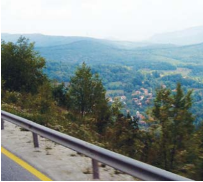
Şar Dağları eteklerindeki Türk köyleri

Struga nostaljisinden sonra hedefimiz tatlıları ile meşhur Gostivar deyip yola giriyoruz. Şar ve Maya Dağları arasından geçerken " Maya Dağdan kalkan kazlar " türküsünü söylüyoruz. Şar Dağları eteklerindeki Kocacık Köyü'ne çıkalım istiyoruz. Ancak hava muhalefeti dolayısıyla ile bunu gerçekleştiremiyor ve bir başka geziye bırakıyoruz.