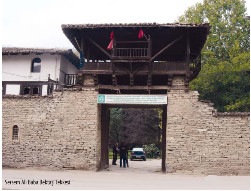
Serssem Ali Baba Bektaşî Tekkesi

Kalkandelen Alaca Camisi , Serssem Ali Baba Bektaşî Tekkesi , Osmanlı Hamamı ve daha birçok Türk eserini içinde bulunduran bir şehir.